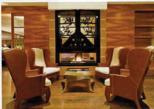
A sinistra. La spa del Lefay Resort. Sopra. La sala relax.