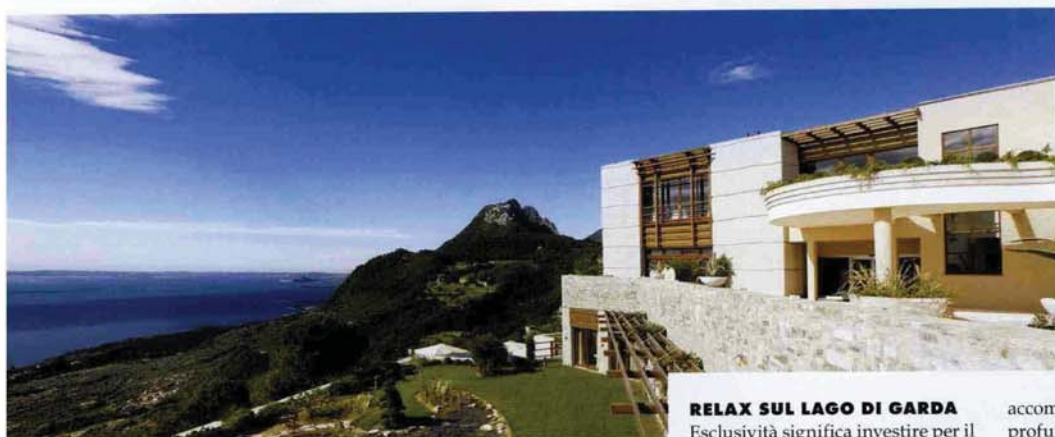
Dall'alto. Un'immagine del Lefay Resort & Spa, sul lago di Garda. La sauna Caligo e l'Infinity Pool.